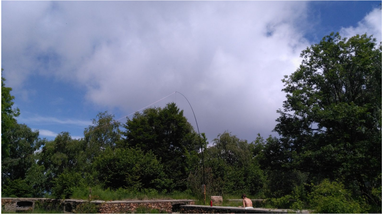
La canna da pesca con la longwire ...e mia moglie che prende il sole