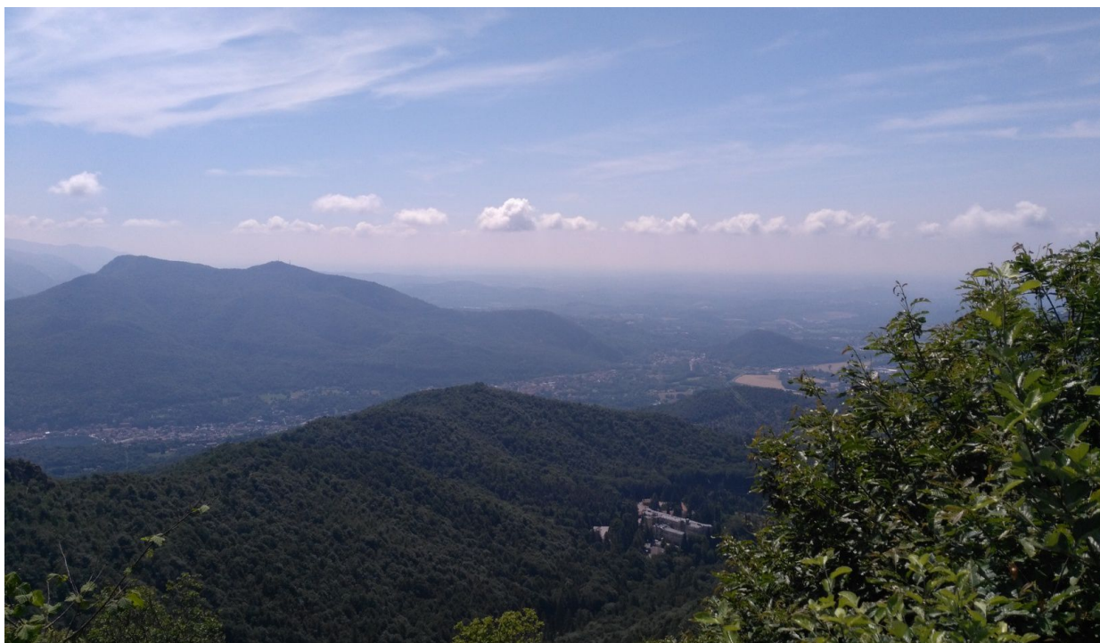
Verso la pianura